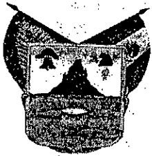
PODER LEGISLATIVO GOBIERNO DEL ESTADO DE HIDALGO